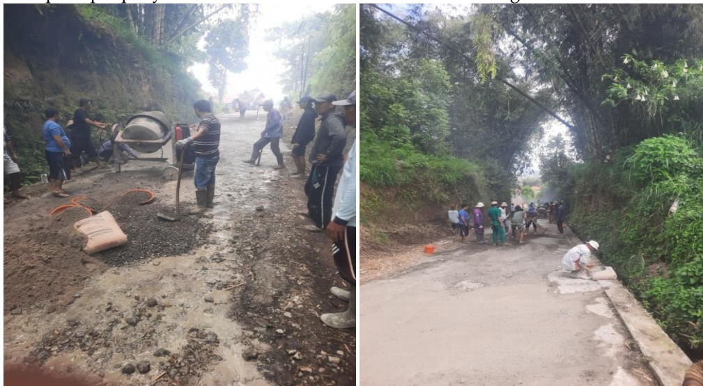
Gambar 2. Proses Perbaikan Jalan, Gotong Royong Warga Memperbaiki Jalan Yang Rusak

Sementara itu, dalam konteks nasional, data BPS (2024) menunjukkan bahwa pembangunan infrastruktur berbasis swadaya menjadi tren nasional. Sebanyak 42% desa melakukan pembangunan melalui inisiatif warga, 38% menggunakan dana desa, dan hanya 20% mengandalkan bantuan pusat. Komunikasi sosial digital juga berperan penting. Studi Nah et al. (2021) menunjukkan bahwa media sosial komunitas dapat memperkuat jaringan komunikasi horizontal di wilayah rural. Di Batagak, grup WhatsApp menjadi media informal yang mempercepat penyebaran informasi dan koordinasi antarwarga.